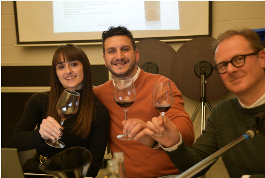
Lachende Italiaanse gezichten