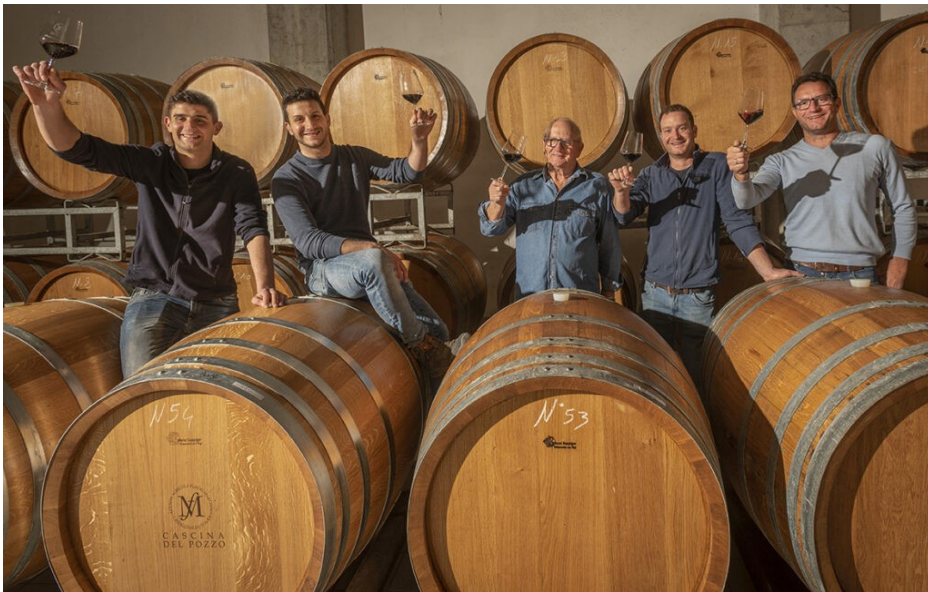
Mooie vatenkelder met de fiere eigenaars

Appellaties: Roero Arneis (Montemeraviglia), Castellinaldo Barbera d'Alba en Roero (Montegalletto en Serra Zoanni)