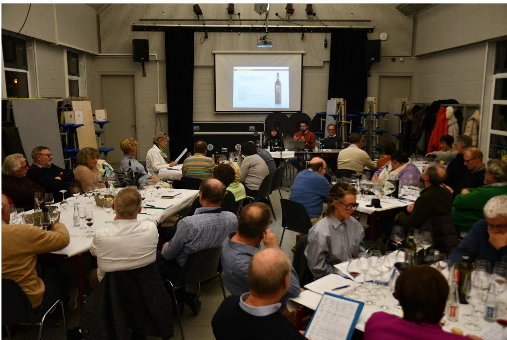
Aandachtige wijnliefhebbers in Kooigem