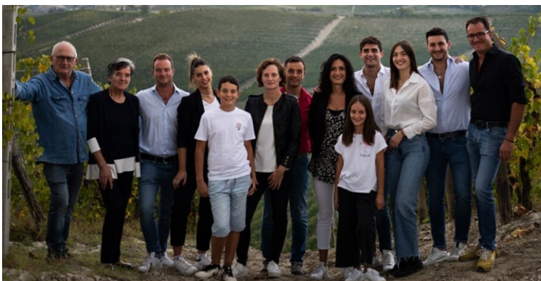
De voltallige familie

De vierde generatie wilde graag groeien en naam maken in de wijnwereld, maar bovenal wilden ze een identiteit... een logo. Aan het begin van de jaren 2000 werd het bedrijf omgedoopt tot CASCINA DEL POZZO. De naam was bedoeld om inspiratie te halen uit en vooral om Flavio's vader te eren voor de grote stap die hij nam in de jaren 1980